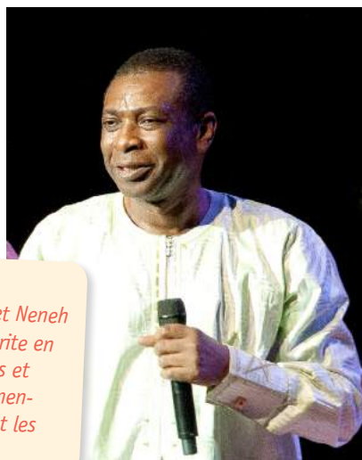
▲ Youssou N'Dour